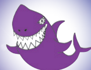
再び登場! シャーくん(仮)