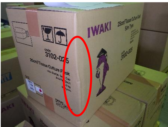
③ お客様に許容頂きたい製品外箱凹みの例